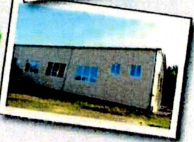
Переоборудование старой котельной в спортивный зал в селе Шангала Петровского района